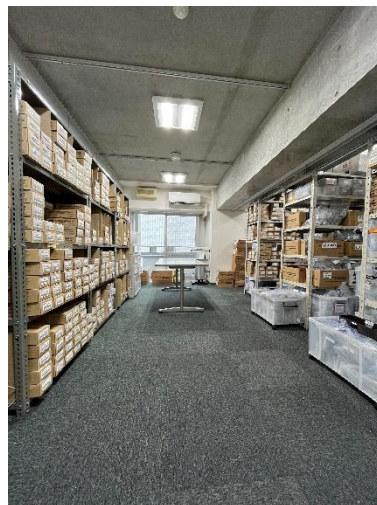
倉庫 (122m 2 )