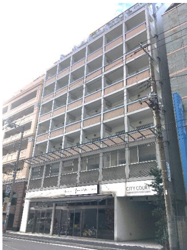
本社事務所 (65m 2 )